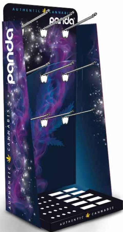
Stand επιτραπέζιο 9 θέσεων (γάντζων) Π 30cm x Β 23cm x Υ 29cm