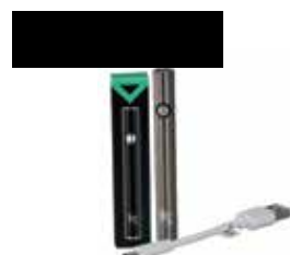
Το προϊόν μπορεί να διαφέρει ανάλογα με το απόθεμα var.0720 ΠΛΤ 15,00€