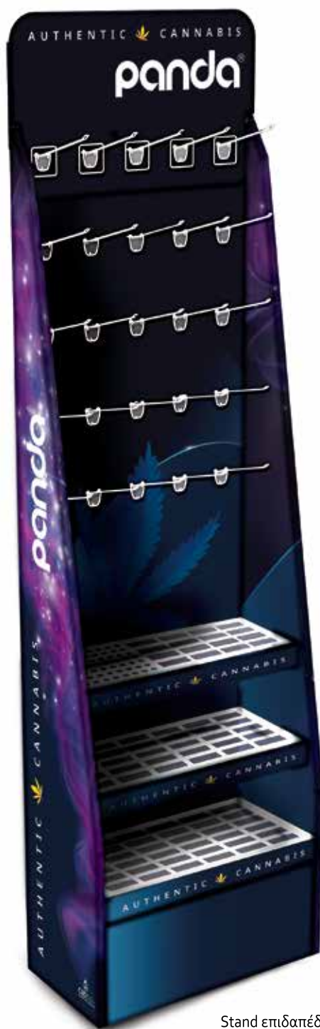
Stand επιδαπέδιο 25 θέσεων (γάντζων) Π 52cm x Β 27cm x Υ 185cm